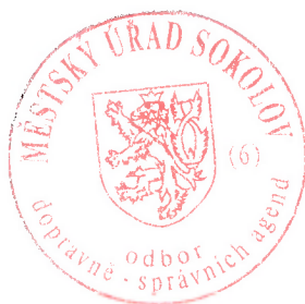
Karel Merxbauer silniční hospodářství

Toto rozhodnutí nenahrazuje stavební povolení.